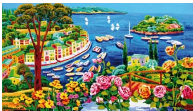
"Dalla collina - Portofino"

Il senso di una pittura leggibile e carica di emozione